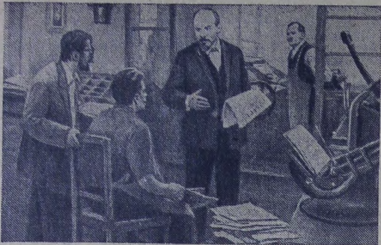
«Искра». Картина художника Д. Налбандяна.

24 декабря — 75 лет со дня выхода (1900) первого номера общерусской нелегальной марксистской газеты «Искра»