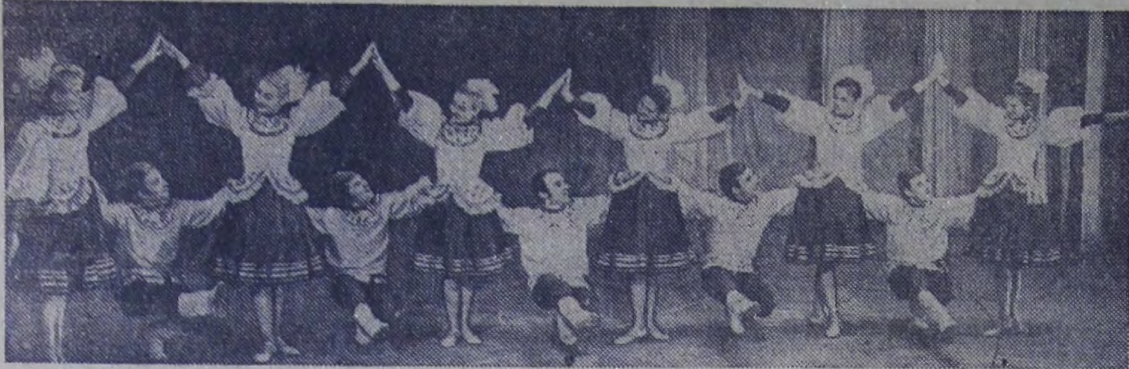
Вологодская область. Самодеятельный танцевальный ансамбль «Северные зори» — один из старейших художественных коллективов города Череповца. За десять лет существования коллектива, в составе которого химик, строители, рабочие металлургического завода, выступал более чем в 100 городах страны. Недавно самодеятель-

ные артисты вернулись из гастрольной поездки в Венгерскую Народную Республику.