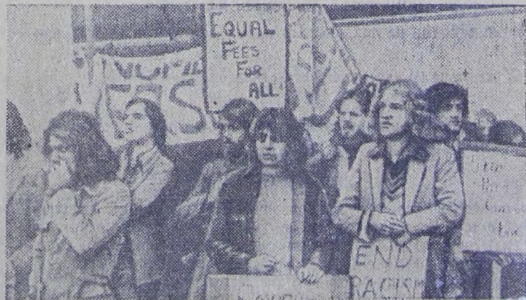
Студенты Англии выступают против расовой дискриминации в вузах страны. На снимке: пикет студентов Манчестера, требующих равенства для всех учащихся.