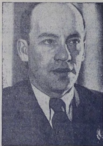
премии СССР, награжден орденом и медалями.

Заслуги Дунаевского в развитии советской музыки были высоко оценены партией и правительством. Он был дважды удостоен звания лауреата Государственной