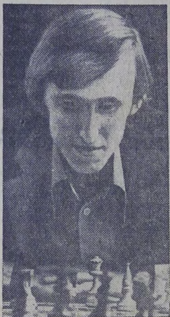
Чемпион мира по шахматам среди юношей Валерий Чехов.

веществами. В домашних условиях после стирки изделия прополаскивают в слабом растворе уксусной кислоты (особенно изделия из натурального или искусственного шелка). На предприятиях химической чистки и крашения одежды применяется препарат ГКЖ-94, бутилтитанад, антиспениватель ФС-58. Отделка этим препаратом способствует восстановлению целого комплекса положительных качеств изделий: водоотталкиваемости, грязеотталкиваемости, наполненности, улучшению физико-гигиенических свойств, ослаблению способности удерживать статическое электричество, что очень важно для из-