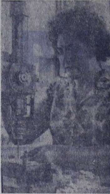
Продукция ширпотреба, выпускаемая заводом им. Дзержинского, пользуется большим спросом.