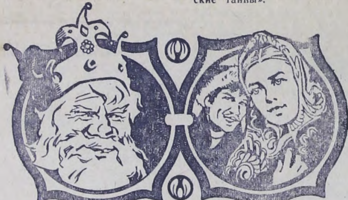
ИВАН ДА МАРЬЯ