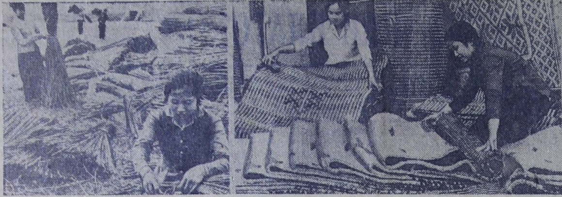
Демократическая Республика Вьетнам. Плетение циновки — традиционный вид народного промысла в провинции Тхайбинь.