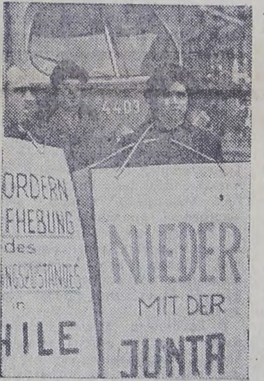
Вена. Марш протеста против фашистского террора чилийской военной хунты состоялся в столице Австрии. Активисты фронта солидарности с Чили пронесли по самой оживленной улице города Мариахильферштрассе плакаты, призывающие крепить солидарность с борьбой чилийского народа. Демонстранты потребовали освобождения всех политических заключенных, томимых в застенках хунты.