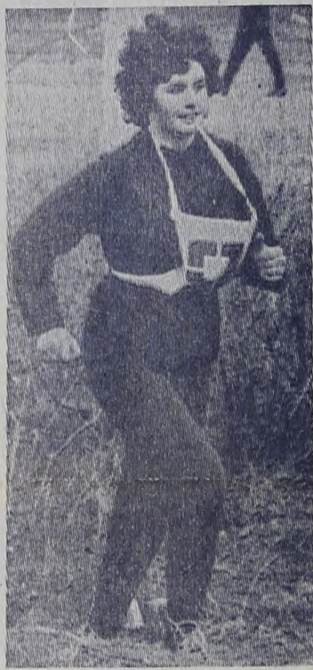
На дистанции кросса.