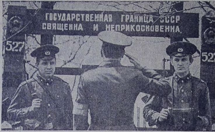
На снимке: наряд готов выступить на охрану государственной границы СССР.

Пограничники Сахалинского отряда с честью несут бесшумную вахту по охране дальневосточных рубежей нашей Родины.