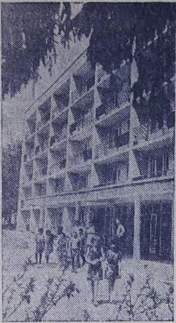
Дом отдыха «Авангард» в Немирове популярен у тружеников Винницкой области. Его уютные корпуса расположены в тенистом парке. К услугам отдыхающих — столовая, библиотека, кинотеатр, спортивные площадки, водная и лодочная станции.

В нынешнем году в здравнице построен новый корпус, рассчитанный на 212 человек.