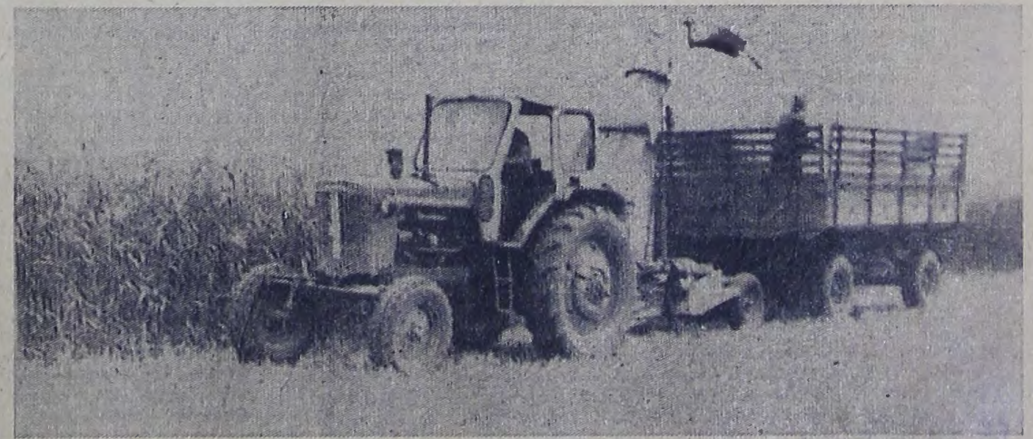
На шестидесяти гектарах размещены в колхозе имени Кирова посевы суданской травы. Первый укос дал по 25 центнеров сена с каждого гектара. После подкормки минеральными удобрениями и полива трава быстро пошла в рост. Сейчас матвейцы снимают второй укос. Часть его в виде зе-

ции Генеральный секретарь ЦК КПСС Л. И. Брежнев. Это выступление транслировалось всеми радиостанциями и телецентрами СССР, передавалось по системе «Интервидение». Глубоко содержательное выступление товарища Л. И. Брежнева с огромным вниманием слушали и смотрели десятки миллионов людей в нашей стране и в братских социалистических странах. Ораторы, выступавшие на совещании, отмечали, что отныне созданы реальные условия для мира, безопасности и конструктивного сотрудничества на континенте. Подписываемый сегодня заключительный акт своим содержанием обращен в будущее. В этом документе заложены основополагающие принципы взаимоотношений государств Европы, определены направления и конкретные формы сотрудничества в торговой-экономической, научно-технической и других областях. Совещание по безопасности и сотрудничеству в Европе выражает ожидания народов, их надежду на лучшее будущее, и нет сомнения, что оно впишет новую, важную страницу в историю Европы.