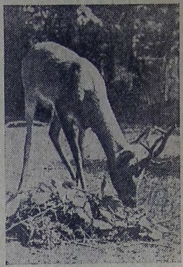
Жигулевские горы — одно из красивейших мест на Волге. Здесь, в самой возвышенной и живописной части Самарской луки, находится Жигулевский государственный заповедник, в котором обитают сорок видов млекопитающих, около 180 видов птиц, произрастает более ста видов местной флоры.

Заповедные Жигули служат настоящей лабораторией для ученых. Этот музей живой природы ежедневно посещают экскурсанты, которых привлекает красота нетронутых лесов, возможность увидеть своими глазами жизнь непуганных птиц и зверей.