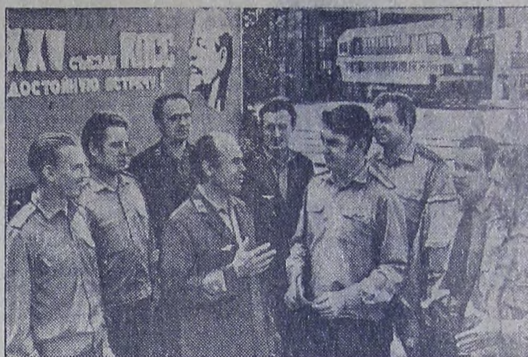
На снимке справа: группа передовых машинистов.

На снимке слева: на путях Московской железной дороги у Киевского вокзала.