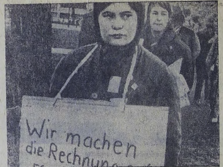
ФРГ. Инфляция и рост цен влекут за собой ухудшение условий жизни и учебы студентов. Учащиеся выступают с требованиями улучшить их материальное положение, увеличить стипендии (на снимке).