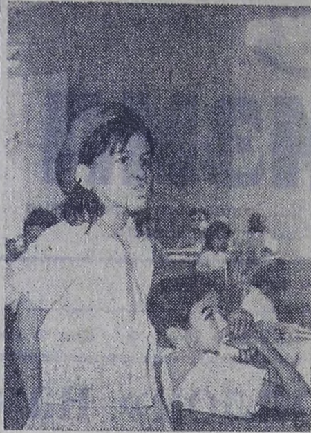
Школьный городок имени 26 июля в Сантьяго-де-Куба — первое крупное учебное заведение на Кубе, созданное революционным правительством. Здесь обучается около четырех тысяч кубинских ребят. На снимках: на уроке в начальной школе.