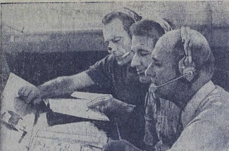
Американские астронавты, участвующие в совместной программе «Союз-Аполлон», — Дональд Слейтон, Вэнс Бранд и Томас Стаффорд (слева направо).