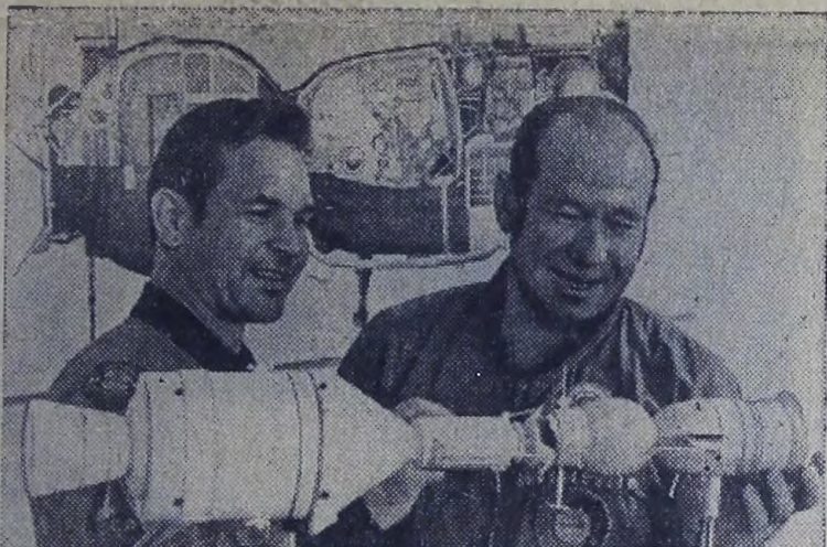
Первый экипаж космического корабля «Союз», участвующий в совместной программе «Союз-Аполлон», — Алексей Архипович Леонов и Валерий Николаевич Кубасов.

Хьюстон. Центр управления полетом. Запуск советского космического корабля «Союз-19» вызвал здесь живой интерес. За несколько минут до старта в центре установилась необычная тишина: внимание всех присутствующих было приковано к экранам телевизоров, на которых показывались события, происходившие на противоположной стороне планеты, в далеком Байконуре. После того, как диктор объявил, что «Союз» вышел на орбиту, американские специалисты поздравили находящуюся здесь группу советских специалистов с успешным стартом «Союза». (ТАСС)