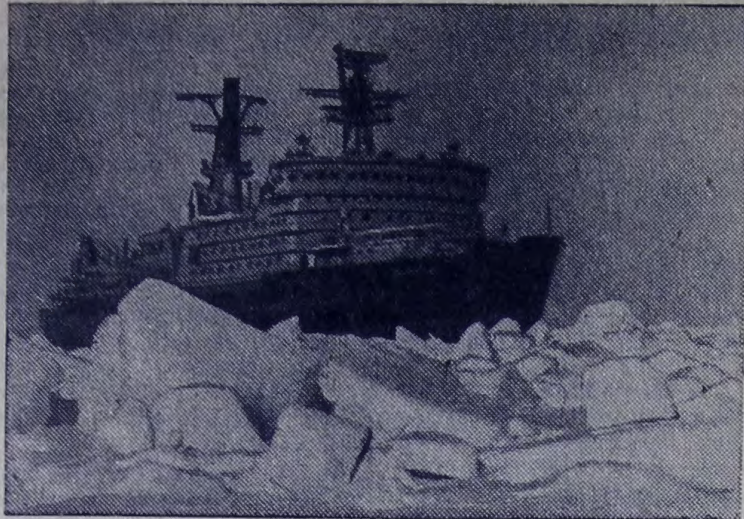
Арктическую навигацию 1975 года открыл флагман советского ледокольного флота атомоход «Арктика», выйдя из Мурманска в свой первый рабочий рейс.

Построенный в Ленинграде ледокол оснащен мощнейшей в мире энергетической установкой, которая позволяет успешно преодолевать тяжелые льды в высоких широтах.