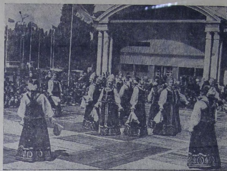
КИЕВ. Всесоюзный фестиваль искусств «Киевская весна». Здесь показывали свое мастерство известные художественные коллективы.

За справками обращаться по адресу: ул. Строительная, 39, телефоны: 40-36 или 2-01-14.