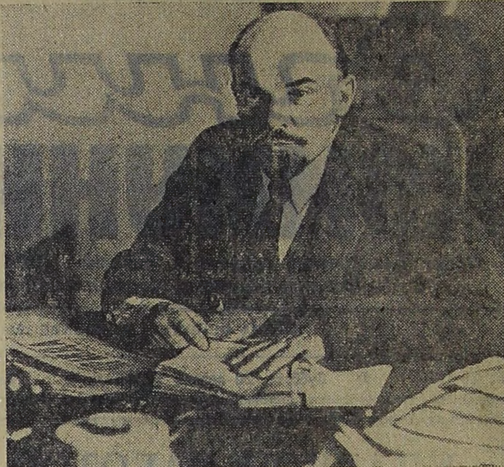
В. И. Ленин в своем кабинете в Кремле. Москва, октябрь 1913 года.

директор электромеханического завода Саратовгэстроя