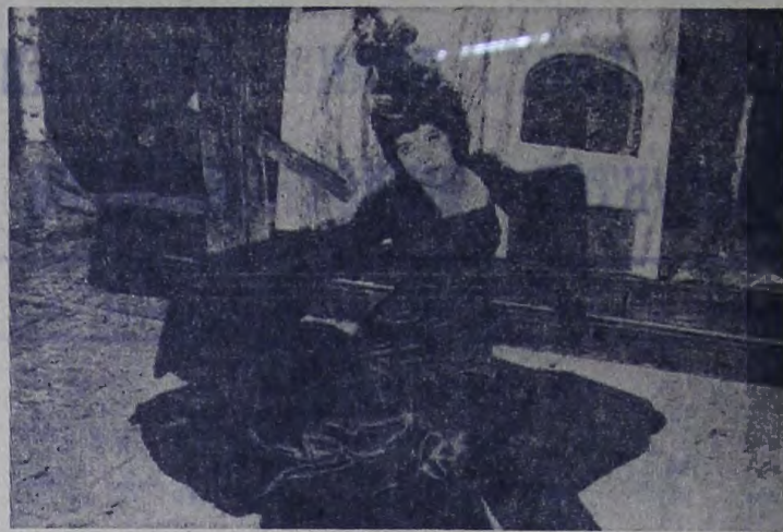
В дни весенних школьных каникул в Доме пионеров Саратов-гэстроя была показана новая работа драматического кружка — сказка Любимовой «Одолень-трава». Режиссер — Н. В. Добровольская.