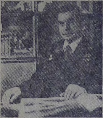
Замечательному советскому авиаконструктору Сергею Владимировичу Ильюшину 31 марта исполняется 80 лет.

В 1933 году С. В. Ильюшин возглавил организованное им вместе с Н. Н. Поликарповым, Д. П. Григоровичем и С. А. Кочергинным Центральное конструкторское бюро. Здесь были созданы прославившиеся в сражениях Великой Отечественной войны боевые самолеты. Это бомбардировщик «ИЛ-4», легендарные штурмовики «ИЛ-2», а потом «ИЛ-10», наводившие ужас на немецких захватчиков. Самолет «ИЛ-12» положил начало созданию современного самолета парка гражданской авиации СССР. Всему миру известны великодушные воздушные лайнеры «ИЛ-18» и «ИЛ-62».