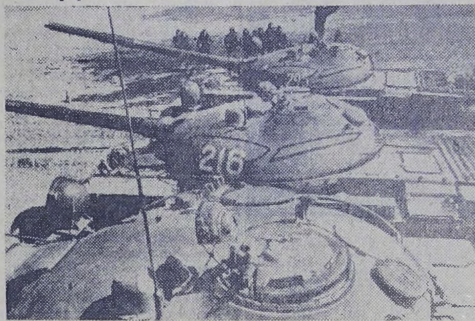
Сейчас вздревут двигатели, и танки устремятся вперед.