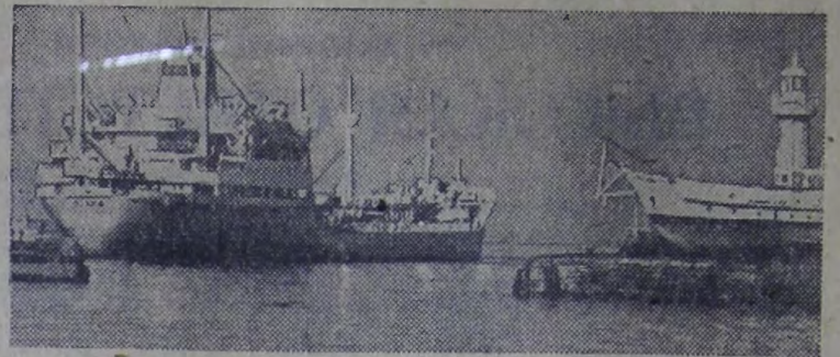
Грузинская ССР. От причалов батумского морского порта уходят в дальнее плавание танкеры с грузом нефтепродуктов для Республики Куба. Суда, уходящие на остров Свободы, отправляются со значительным опережением графика. На снимке: танкер «Искра» Ввороссийского пароходства берет курс к берегам Кубы.