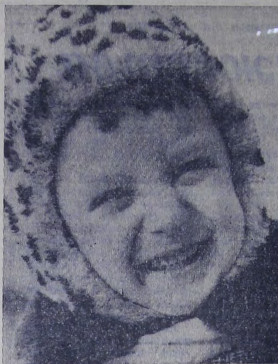
В ОБЪЕКТИВЕ — ДЕТИ.