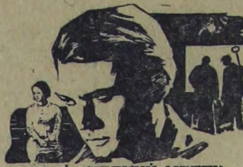
САМЫЙ ЖАРКИЙ МЕСЯЦ

Фильм рассказывает о красоте трудящегося человека, о его вере в свои возможности.