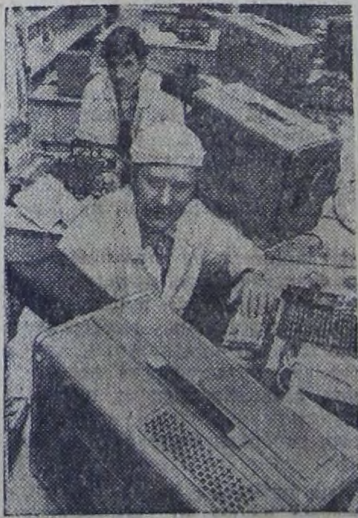
Вильнюсский завод электросчетчиков за год выпускает свыше двух миллионов изделий.