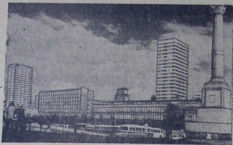
Варшава. Многоэтажные башни современных зданий, красивые павильоны центральных магазинов построены сейчас на Маршалковской улице. Эта центральная магистраль города протянулась на несколько километров, прямая, просторная, всегда оживленная.