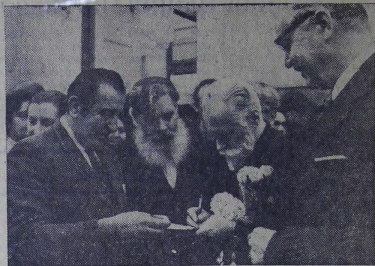
Москва. Мудрость мира, духовное величие и могущество человека, непреходящая красота земли — все это нашло отражение в искусстве выдающегося русского живописца, ученого, поэта Николая Рериха. Выставка его произведений, приуроченная к 100-летию со дня рождения мастера, действует в залах Академии художеств СССР. В экспозиции представлены произведения, хранящиеся в музеях Москвы и Ленинграда, Новосибирска и Риги, в частных коллекциях.

Впервые советские зрители увидели так называемую «Богатырскую» серию, созданную в годы Великой Отечественной войны. В образах богатырей-воинов, отстаивавших Русь от захватчиков, художник-патриот воплотил глубокую веру в победу своего народа.