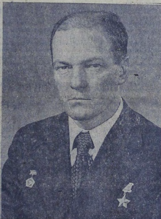
Бортинженер космического корабля «Союз-16» Николай Николаевич Рукавишников, летчик-космонавт СССР, Герой Советского Союза.