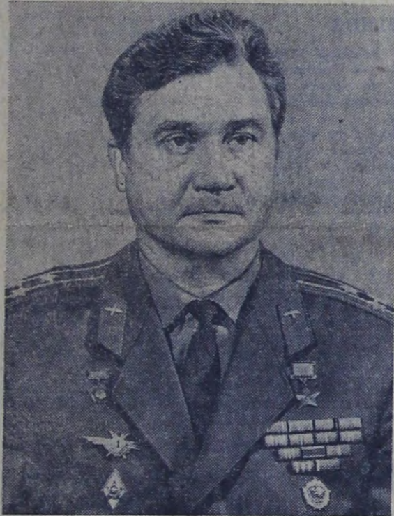
Командир космического корабля «Союз-16» полковник Анатолий Васильевич Филипченко, летчик-космонавт СССР, Герой Советского Союза.