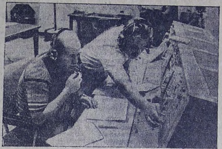
США. В центре пилотируемых космических полетов в городе Хьюстоне идет активная подготовка к совместному полету советского космического корабля «Союз» и американского «Аполлон», который должен состояться в июле 1975 года. Недавно закончился очередной этап подготовки. Основное внимание уделялось обеспечению надежной работы всех систем управления, способствующих полету. На снимке: советские космонавты Алексей Леонов и Валерий Кубасов в момент отработки системы связи между космическими кораблями «Союз» и «Аполлон» в Хьюстоне.