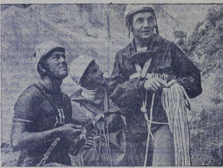
Недавно в Фанских горах побывали альпинисты спортивного клуба «Вертикаль» новосибирского Академгородка.

Фанские горы — небольшой живописный уголок, расположенный в самой высокогорной части СССР, на северо-западе Таджикистана. Большая абсолютная высота, изолированность Фанских гор внутри хребтов, обилие воды, ледников, леса создали здесь здоровый климат.