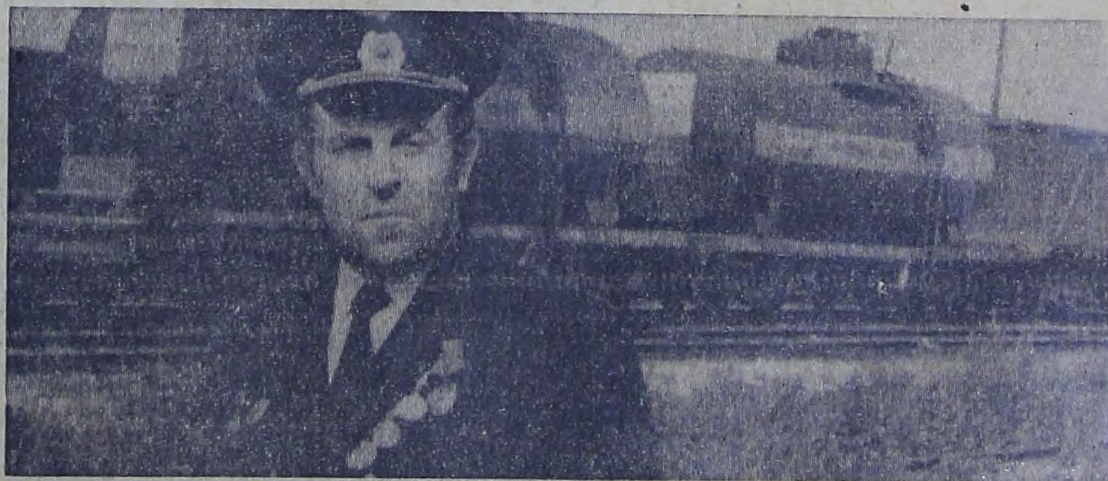
Пять кварталов подряд держит переходящее Красное знамя коллектив железнодорожного транспорта ордена Ленина Саратовгэсстрой. Среди боль-