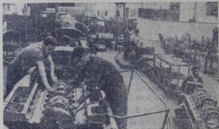
Коллектив крупнейшего в Румынии предприятия — Бухарестского завода «23 августа» активно участвует во всенародном социалистическом соревновании за достойную встречу 30-й годовщины со дня освобождения страны от фашистского ига.

На снимке: сборка дизельных двигателей, предназначенных на экспорт.