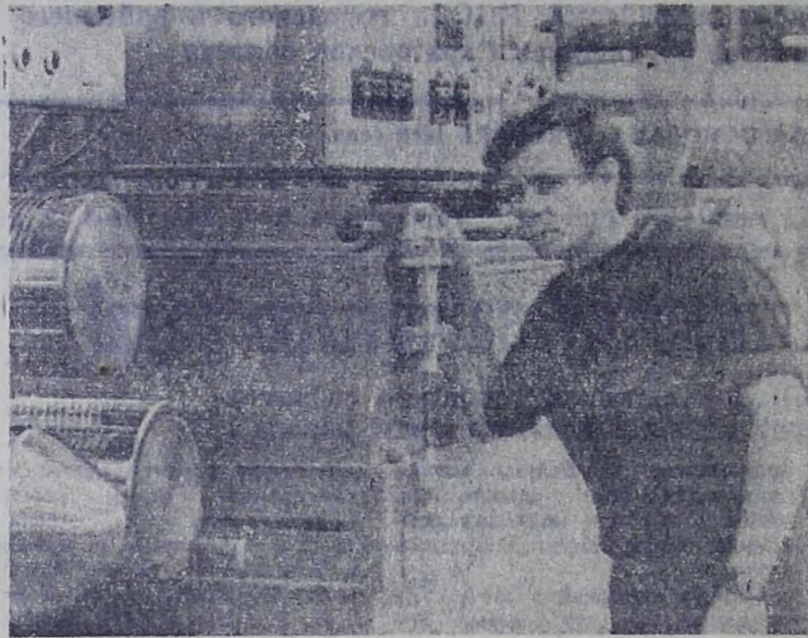
Вступает в строй действующих полипропиленовое производство комбината химического волокна имени В. И. Ленина. Быстрее освоить его и получить ценную продукцию — на это направлены сейчас усилия коллектива.

(Из речи тов. Л. И. Брежнева на XVII съезде ВЛКСМ.)