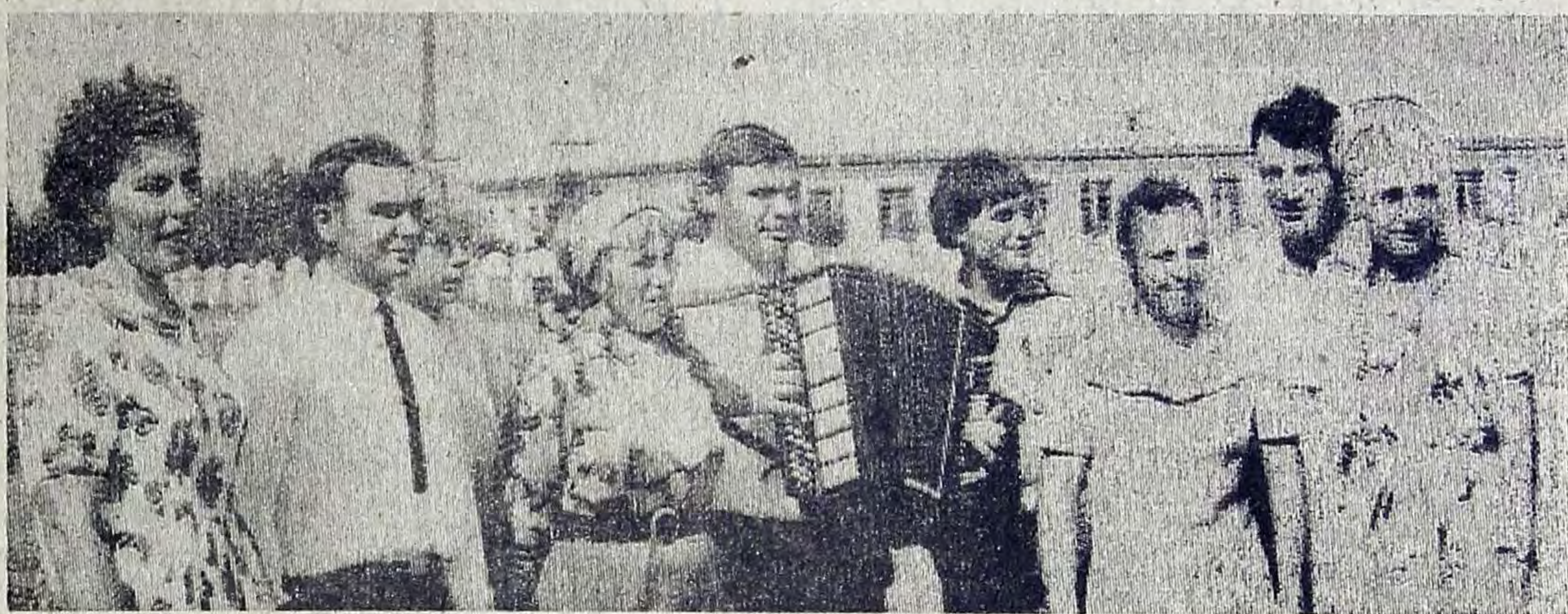
С большим подъемом прошли выборы в местные Советы депутатов трудящихся в с. Паталинно.