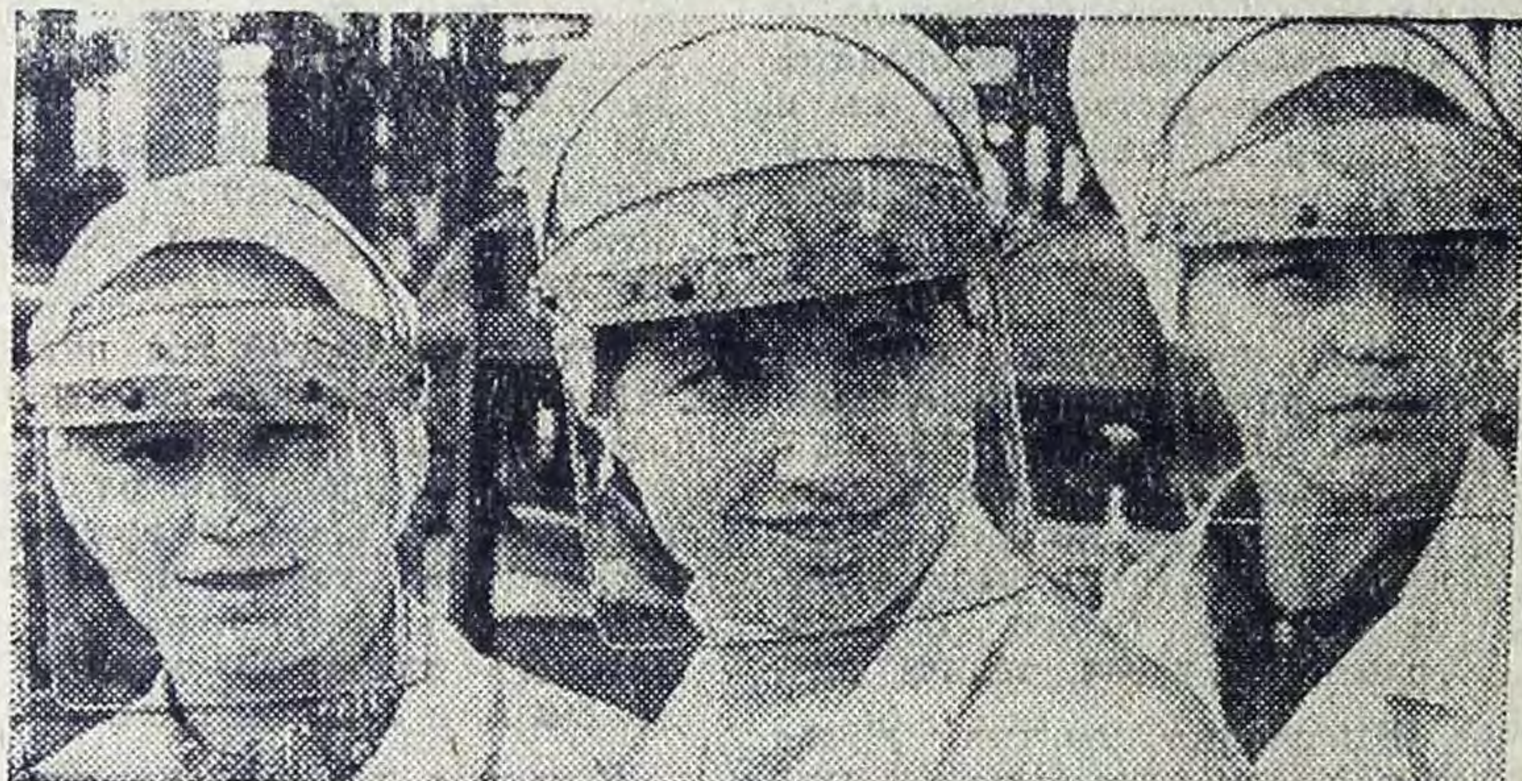
На Новгородском электровакуумном заводе освоено производство новых кинескопов 50 ЛК1Б и 61 ЛК1Б. Меньше полугода потребовалось на освоение их выпуска, хотя заранее было предусмотрено полтора года. Это стало возможным благодаря модернизации оборудования, внедрению прогрессивных технологических режимов на производстве.