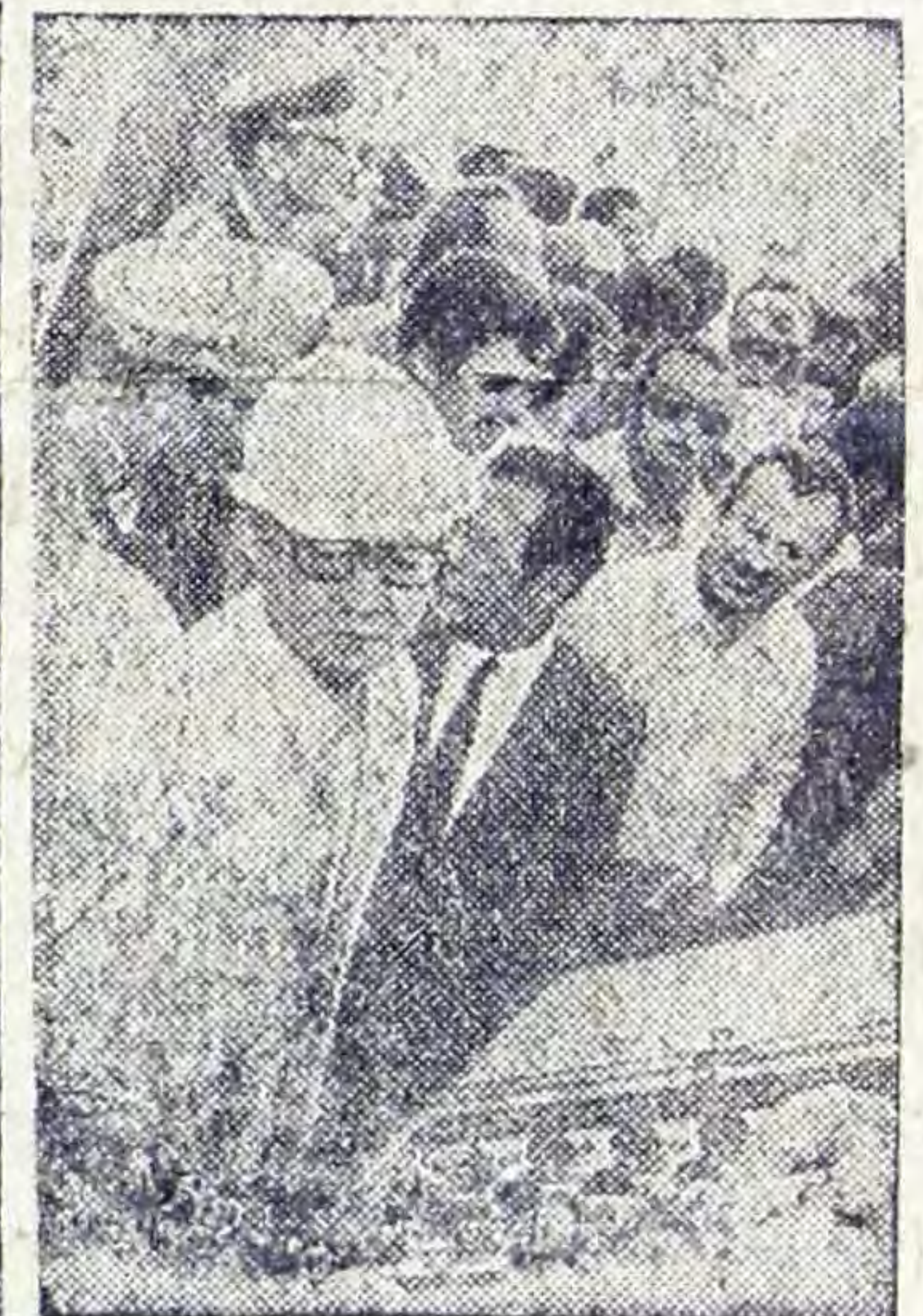
Чили. Два новых горнорудных предприятия построены в городе Вальенаре (провинция Атакама) в период пребывания у власти правительства Народного Единства. Они позволят значительно увеличить промышленное производство в этом районе и обеспечить работой многих жителей провинции.