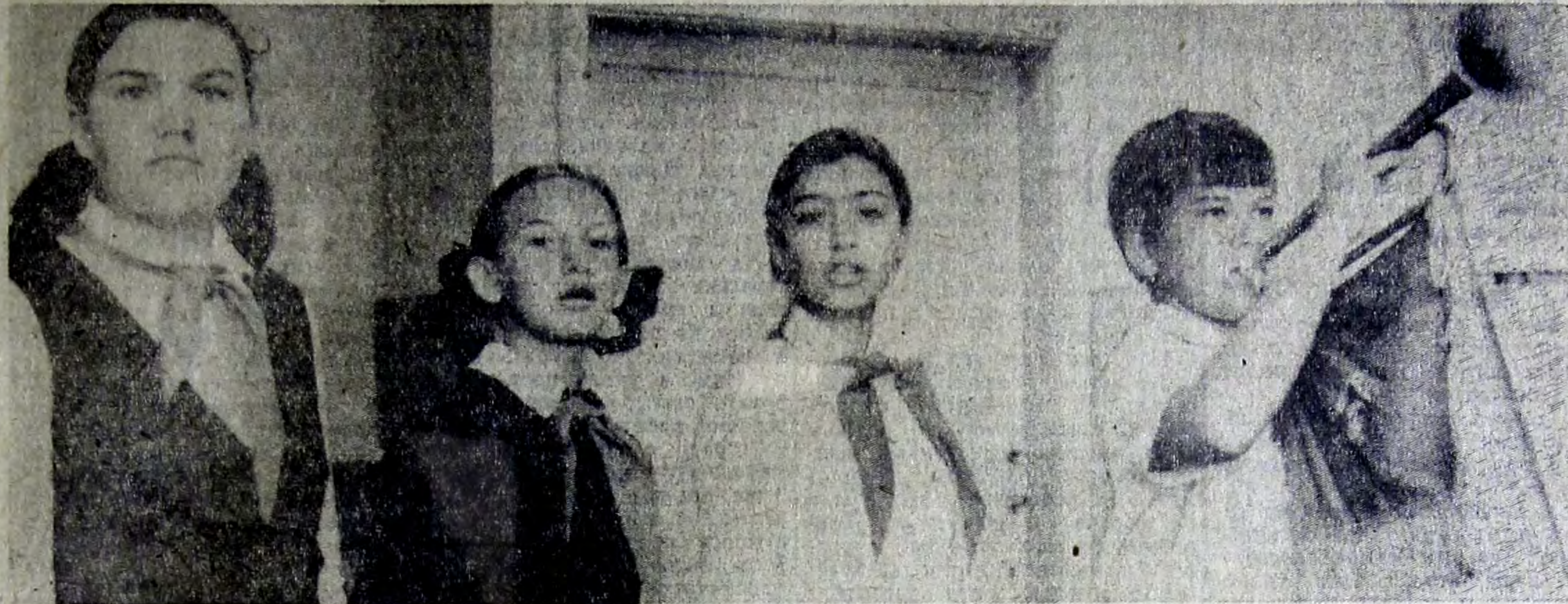
Пионеры правофлангового отряда имени Олега Кошевого школы № 5 активно участвуют в общественной жизни своей школы. На сборе металлолома и на благоустройстве пришкольного участка, выпуске стенных газет, и в школьной самодеятельности — везде идут впереди.