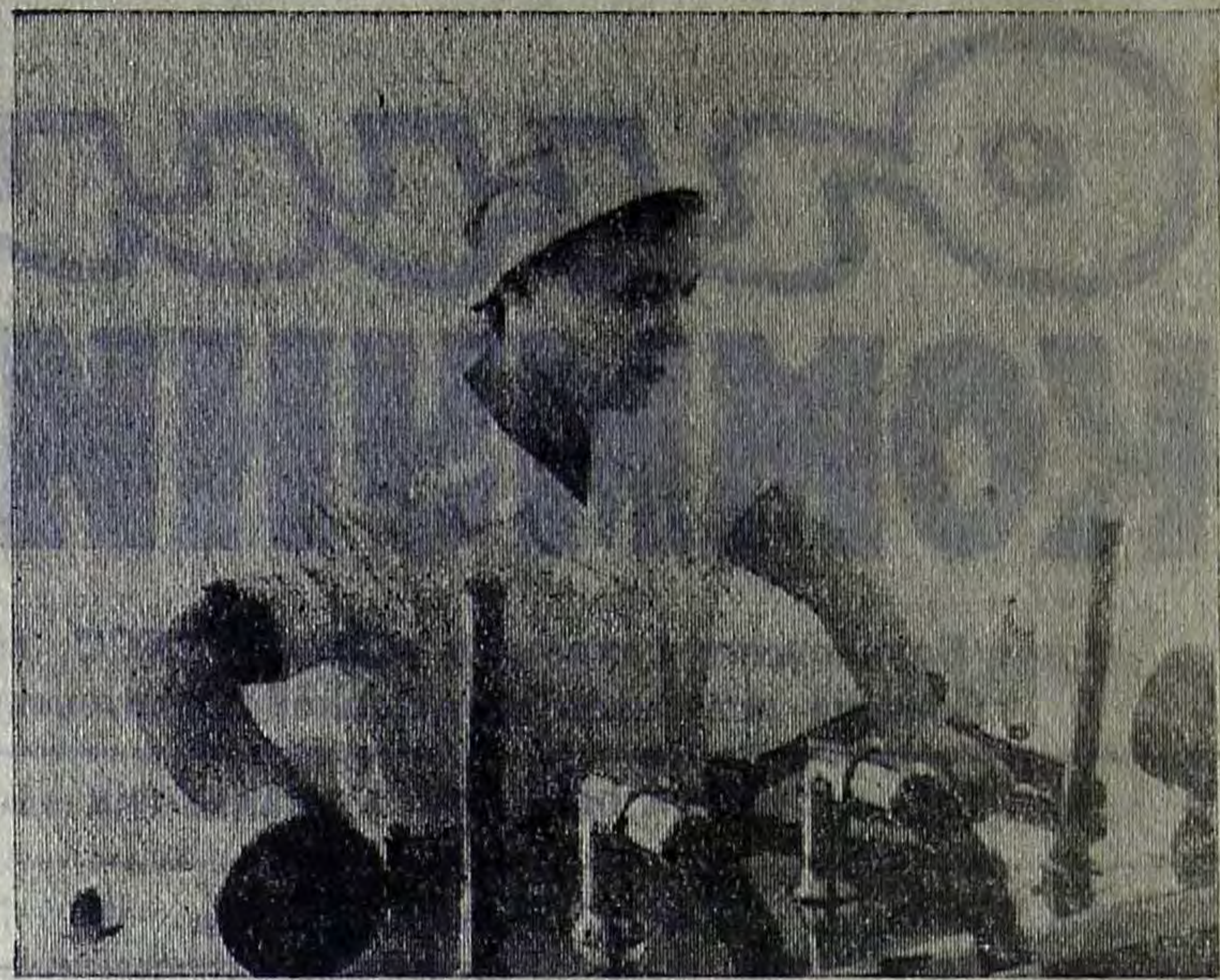
Много благодарностей написано в книге отзывов профилактория комбината химического волокна имени В. И. Ленина в адрес медицинских работников за их безупречный труд.