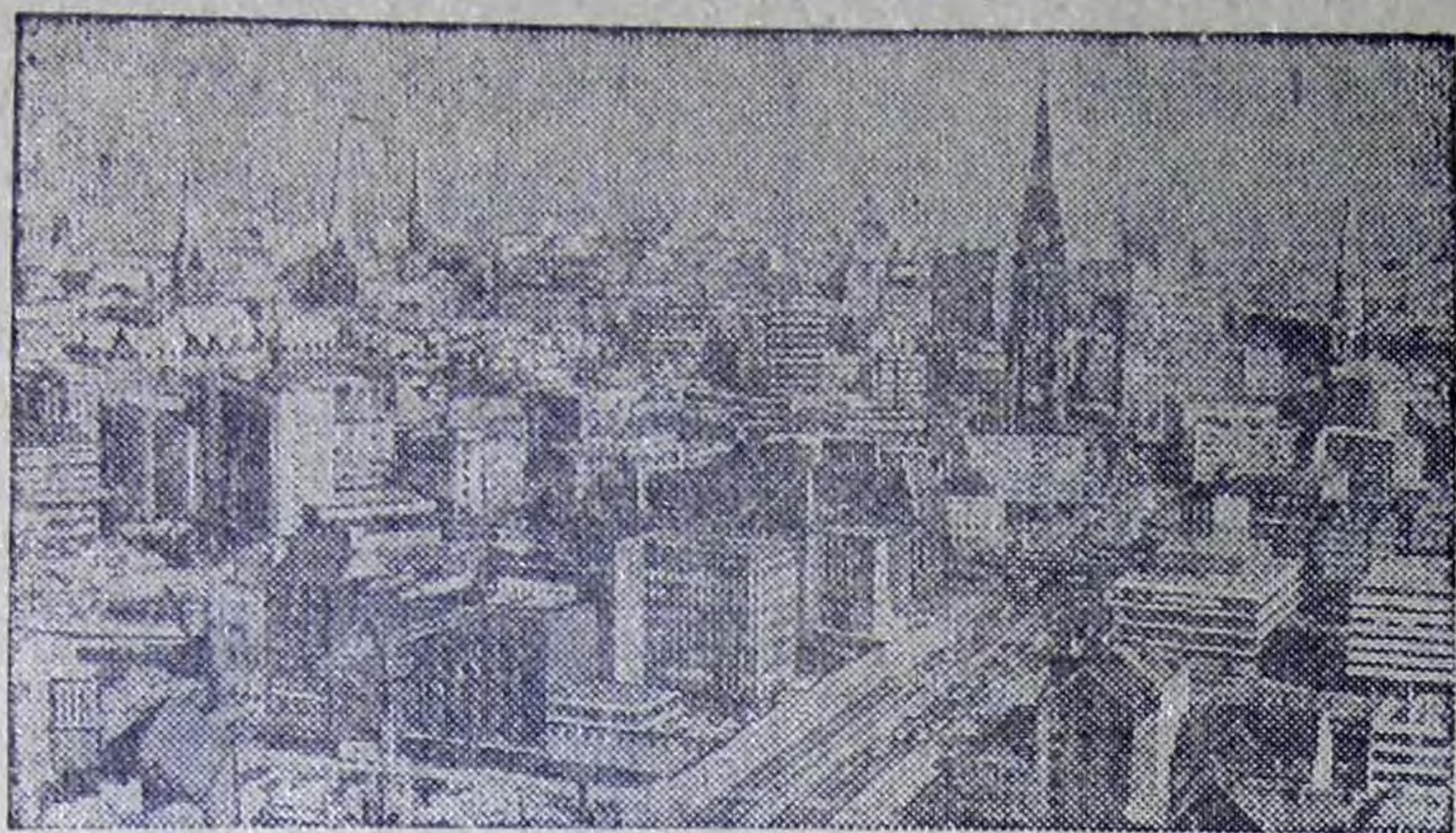
Панорама Гамбурга — крупнейшего промышленного и портового центра ФРГ, города, поддерживающего дружеские связи с советским Ленинградом.