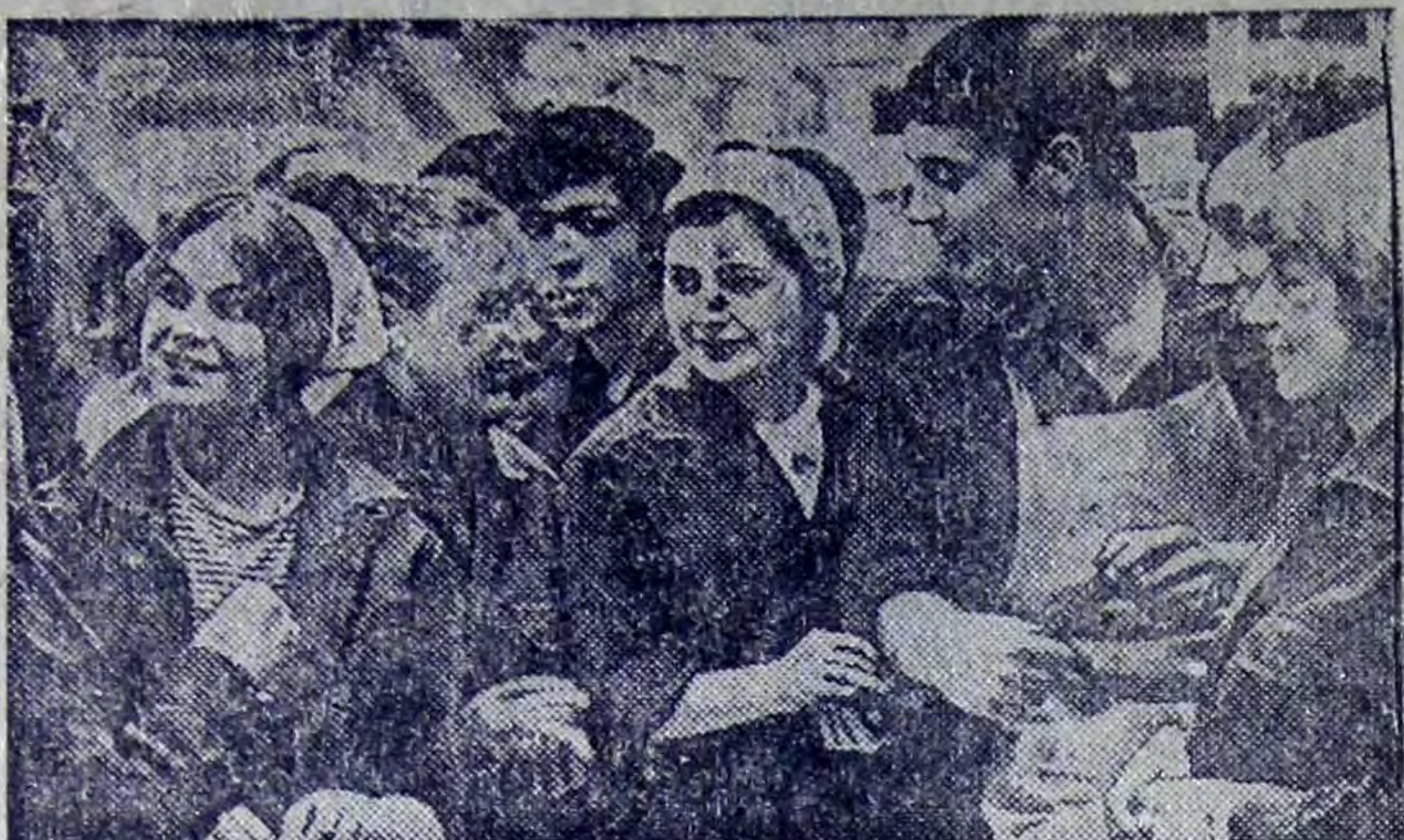
Москва. В Центральном выставочном зале столицы открылась выставка художественной и документальной фотографии, на которой экспонируется около 2000 работ фотомастеров и любителей. На снимках запечатлены трудовые будни нашей многонациональной Родины, ее люди, природа, города и села. Документальные фотографии донесли до нас волнующие моменты истории нашей страны: образование Союза ССР, стройки первых пятилеток, эпизоды Великой Отечественной войны, XXIV съезда КПСС.