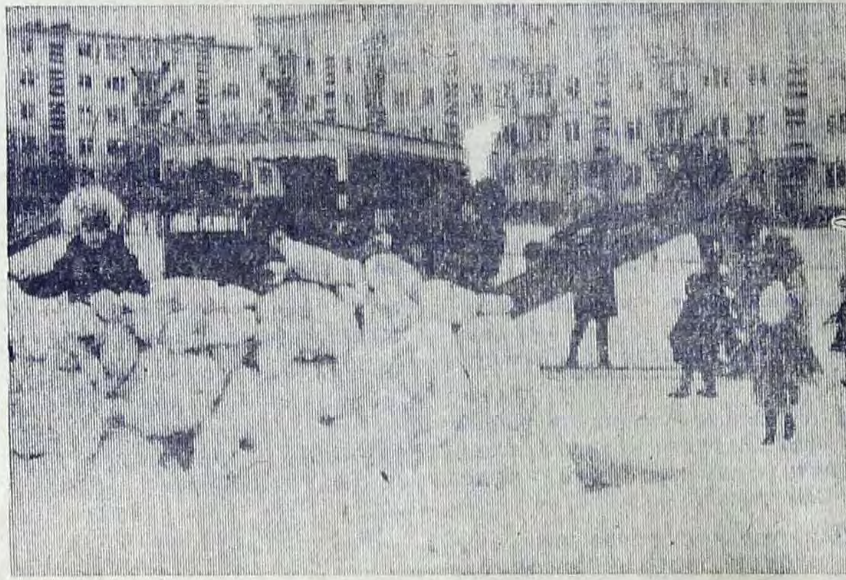
ПРИМЕТЫ ЗИМЫ И ВЕСНЫ. Последние снежные бастионы. Первые «кляксы» на асфальте.