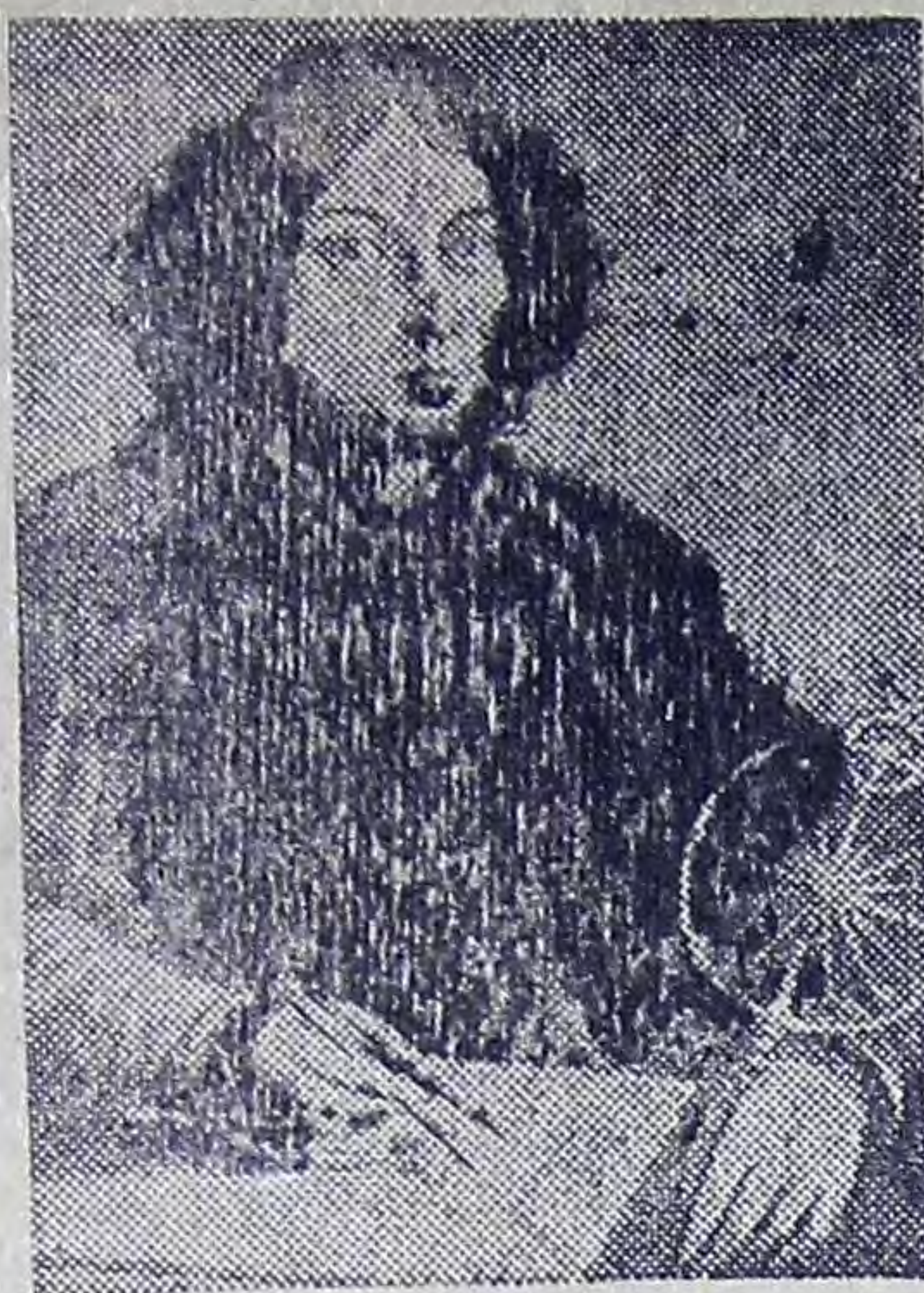
19 февраля исполняется 500 лет со дня рождения великого польского ученого Николая Коперника (1473—1543 гг.), совершившего переворот в ес-

тествознания и возожившего начало современной науке о Вселенной.