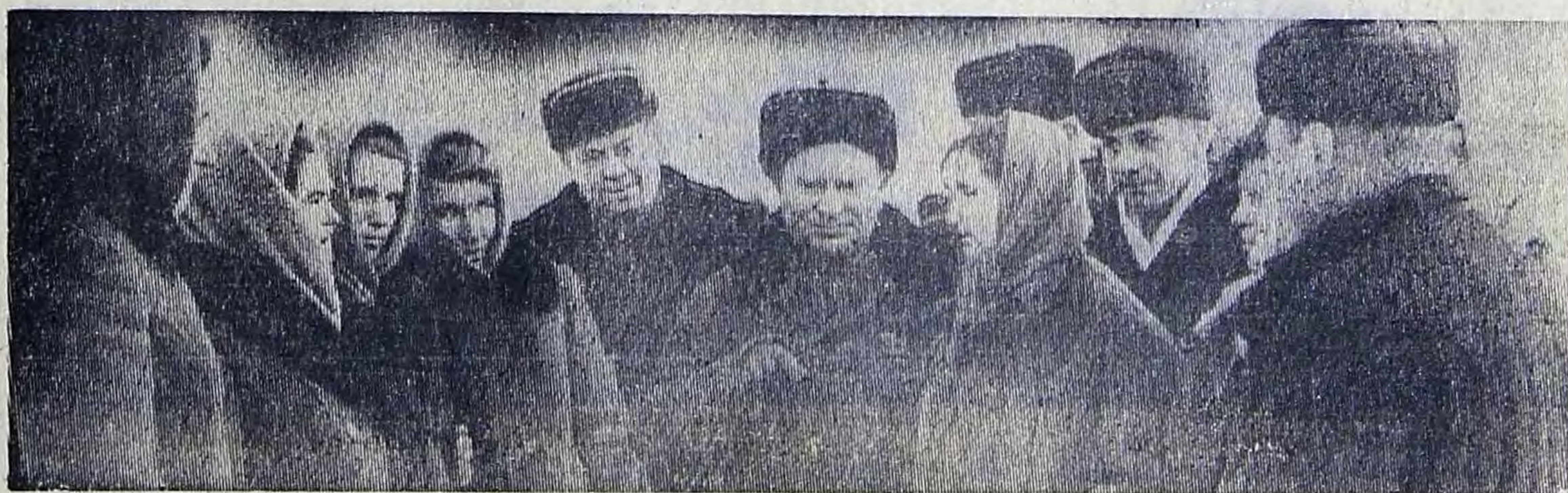
Колхозы «Знамя коммунизма» и имени Свердлова соревнуются между собой. Их представители периодически выезжают друг к другу в хозяйства, проверяют ход выполнения обязательств.