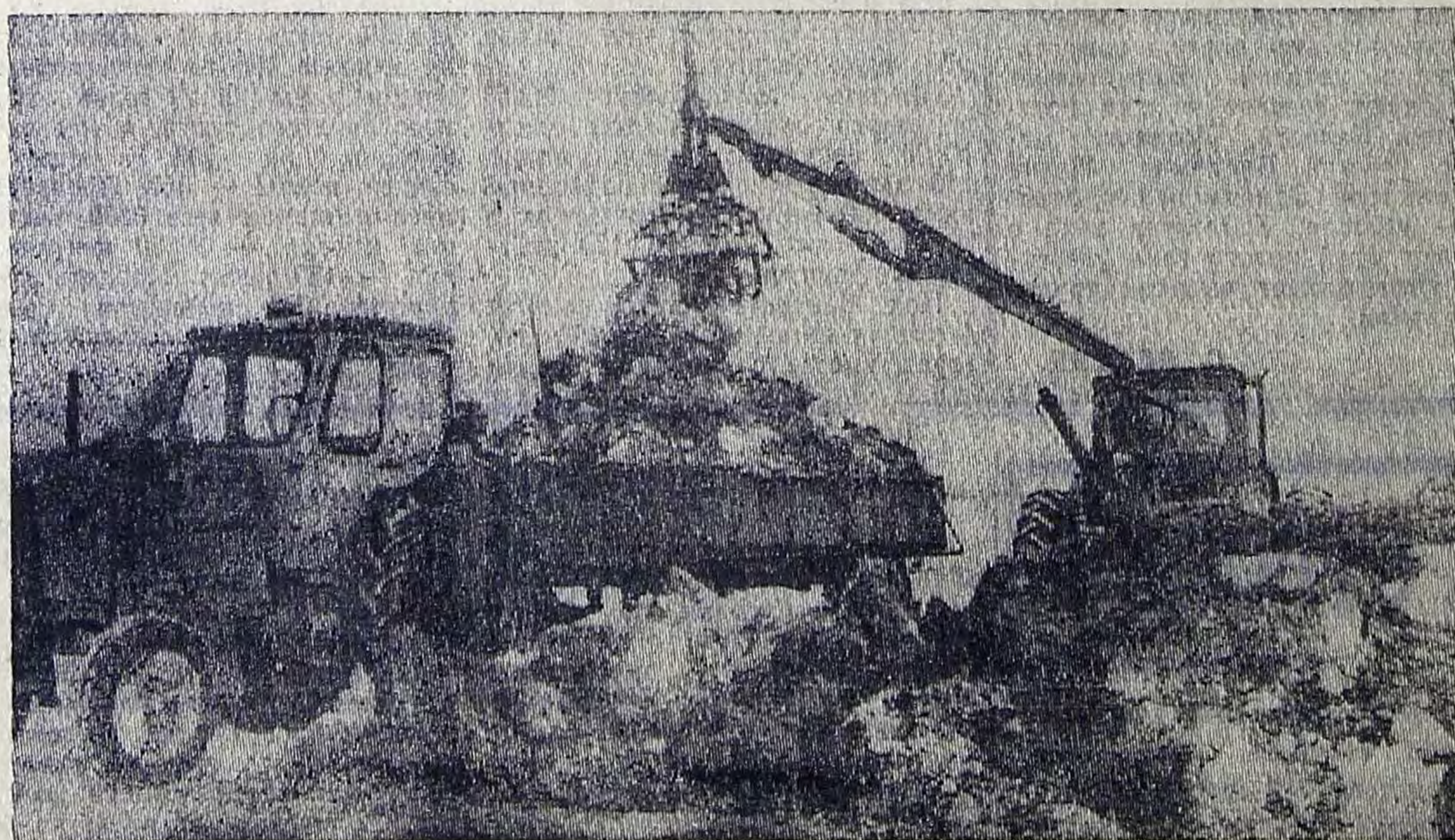
В колхозе имени Кирова ежегодно выполняется план по внесению органических удобрений на поля хозяйства. В эти дни идет интенсивная вывозка навоза. На снимке: на погрузке удобрения.

Наводится порядок и в части соблюдения графиков перерывов, дежурств в зале ответственных лиц. На стройке не стало «затяжных» обедов.