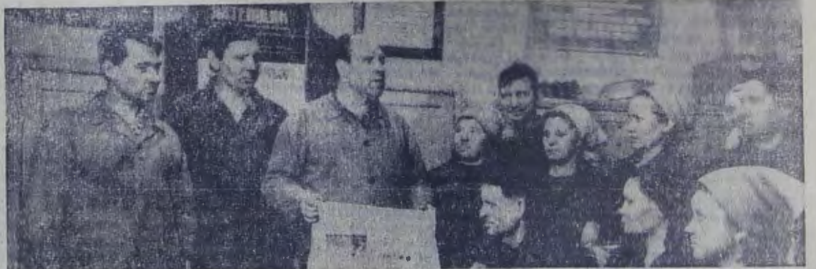
В красном уголке литейного цеха судоремзавода регулярно проводятся лекции, полтинформации, беседы. Этот цех один из первых рапортовал о выполнении плана третьего, решающего года пятилетки.

Работники животноводства, добившиеся наивысших производственных показателей и выполнившие свои обязательства за зимний период, заносятся на районную Галерею передовиков с вручением Почетной грамоты райкома КПСС, исполкома райсовета депутатов трудящихся и райкома профсоюза работников сельского хозяйства.