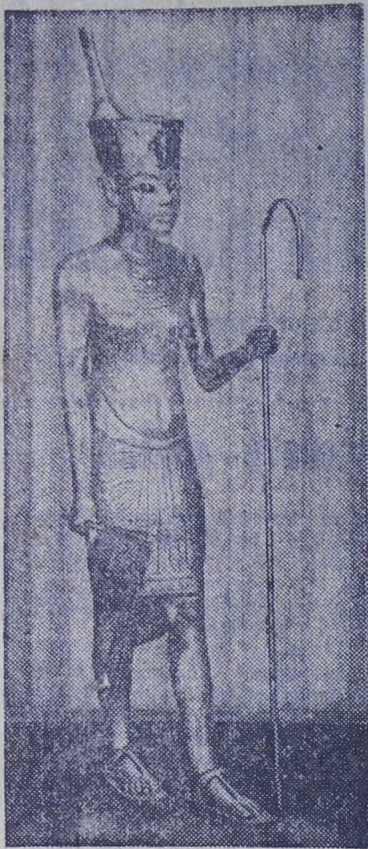
На снимке: деревянная, покрытая листовым золотом, статуэтка Тутанхамона с посохом.