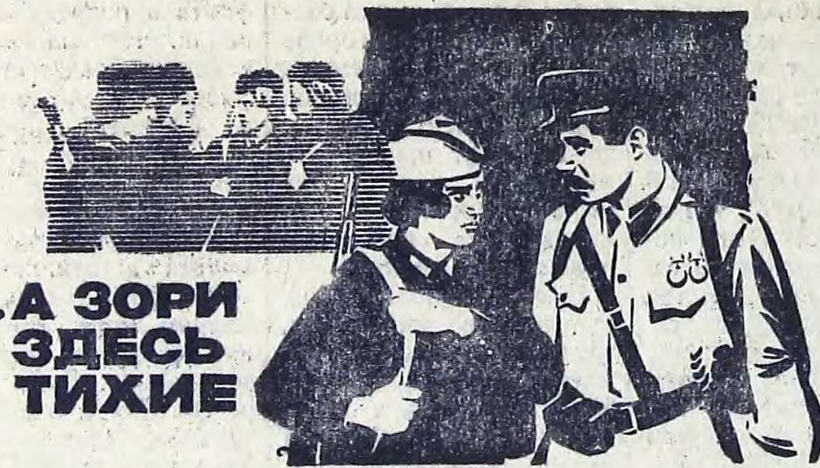
«А ЗОРИ ЗДЕСЬ ТИХИЕ»

Значительным событием в культурной жизни нашего города явился выход на экраны кинотеатров двухсерийного широкоэкранного художественного фильма «А зори здесь тихие», поставленного по повести и сценарию Бориса Васильева режиссером — Станиславом Росточкин. Производство Центральной студии детских и юношеских фильмов имени М. Горького.