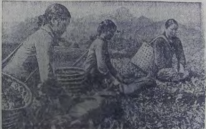
ДРВ. На снимке: сбор чая в совхозе Танчао провинции Туенкуанг.