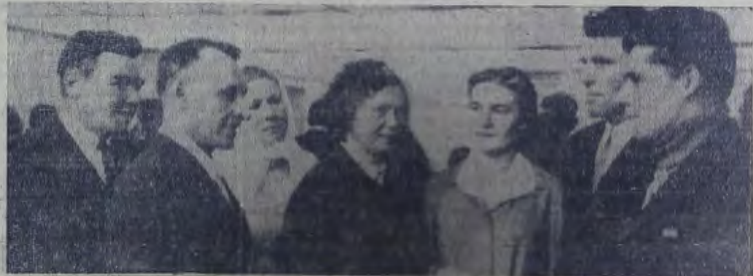
В этом году широко развернулось социалистическое соревнование за увеличение производства и сдачу государству продукции сельского хозяйства между коллективами совхозов «Зоржинский» и «Верезовский». Во время деловых встреч руководители, специалисты, механизаторы, животноводы обмениваются опытом работы, обсуждают насущные проблемы подъяема отраслей производства.