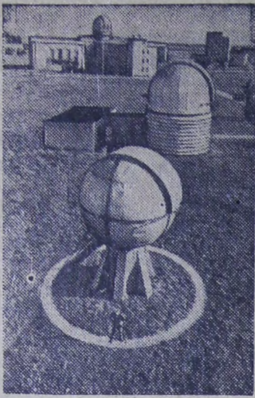
Эстонская ССР. Недалеко от Тарту, в Тыравере, расположена астрофизическая обсерватория имени В. Струве Академии наук ЭССР.

Астрономы проводят фундаментальные исследования звездной динамики, эволюции звезд и серебристых облаков.