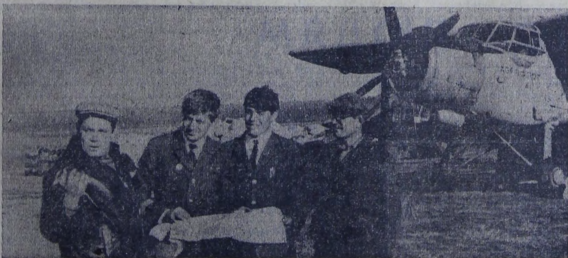
В колхозе имени Чкалова успешно проводится подкормка полей авиацией. В этом году будет подкормлено селитрой, мочевиной и другими минеральными удобрениями 955 гектаров озимых хлебов и около 1000 гектаров под зябь.

Единодушно принято на митинге трудящихся области 12 октября 1973 года.