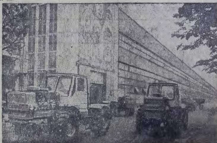
На Харьковском тракторном заводе построен гигантский пещ, где расположен главный конвейер по сборке трактора «Т-150». На предприятии развернулось соревнование за досрочное освоение новых мощностей и наращивание темпов выпуска новой машины.

Коллектив учителей и учащихся школы № 5.