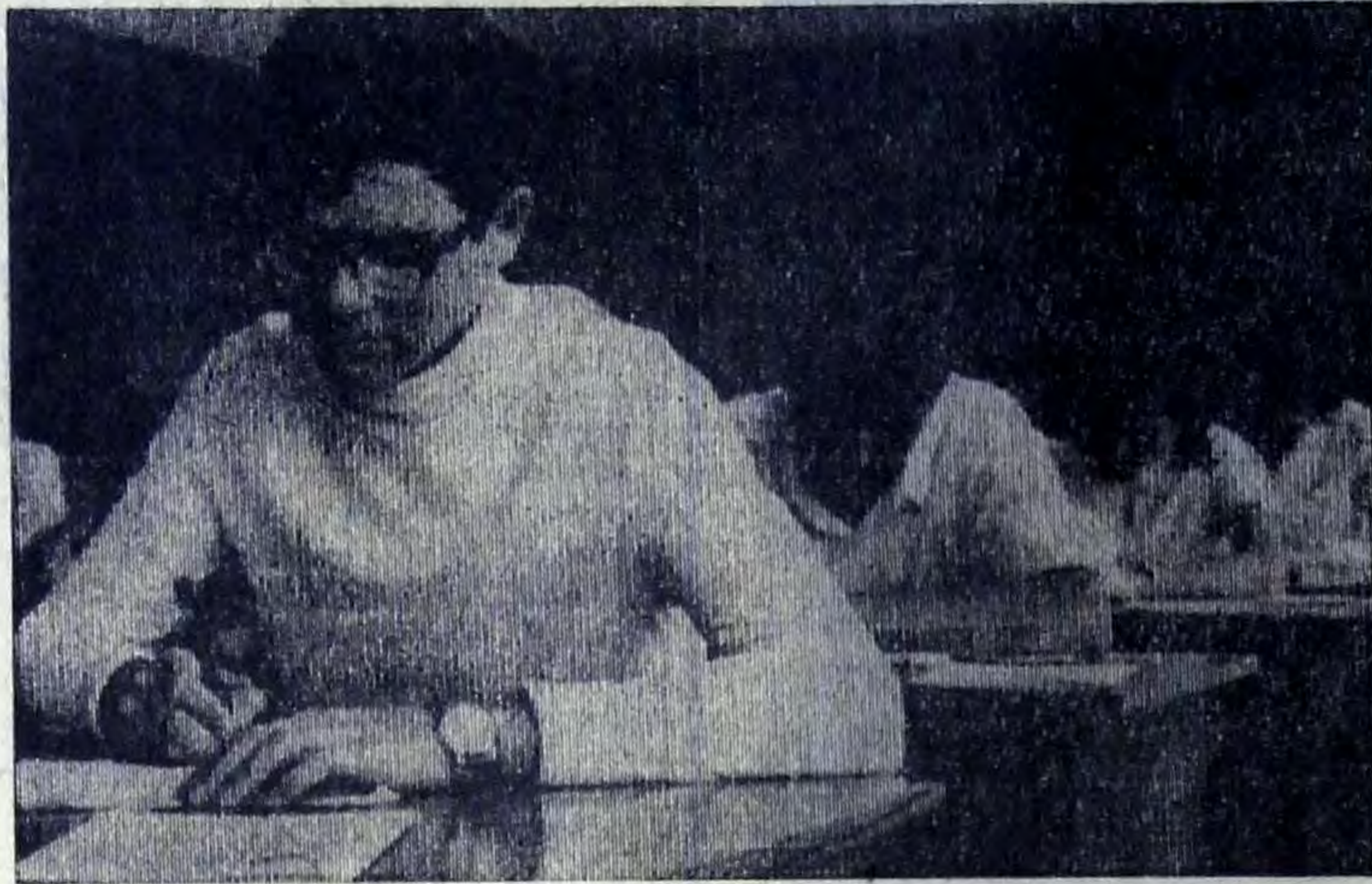
Первый экзамен. Ученики школы № 41 сдают экзамен по русскому языку и литературе (сочинение).