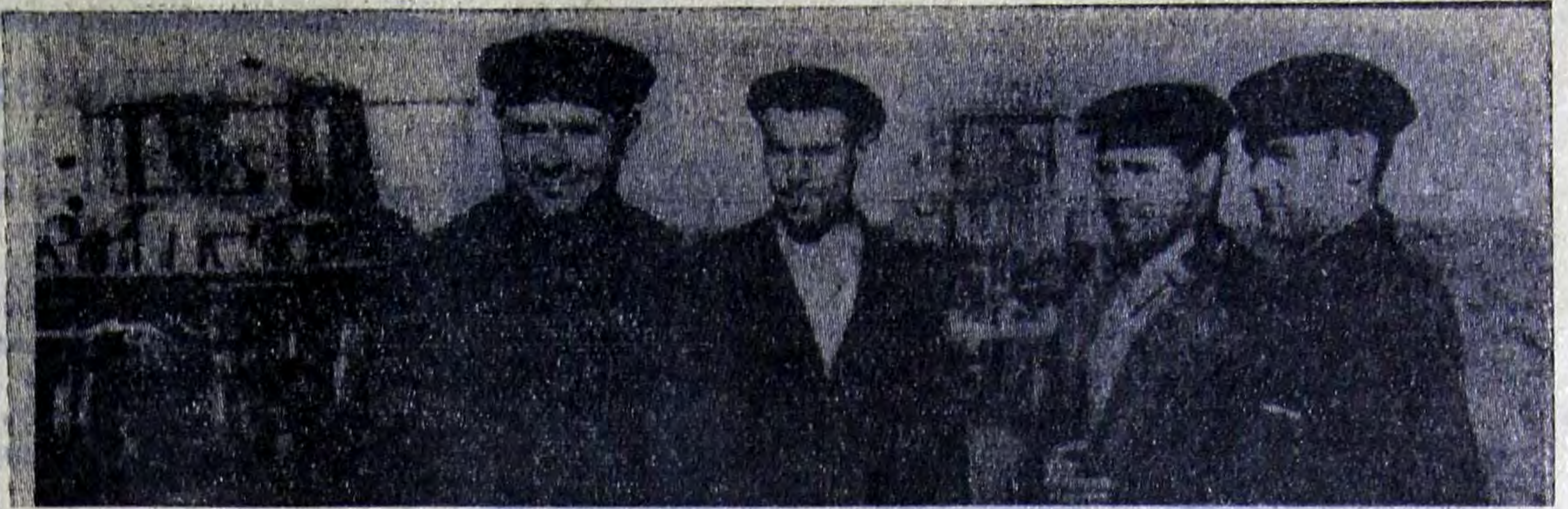
По-ударному трудились механизаторы колхоза «Коммунар» на севе кукурузы.

Особенно хороших результатов на севе добилась третья