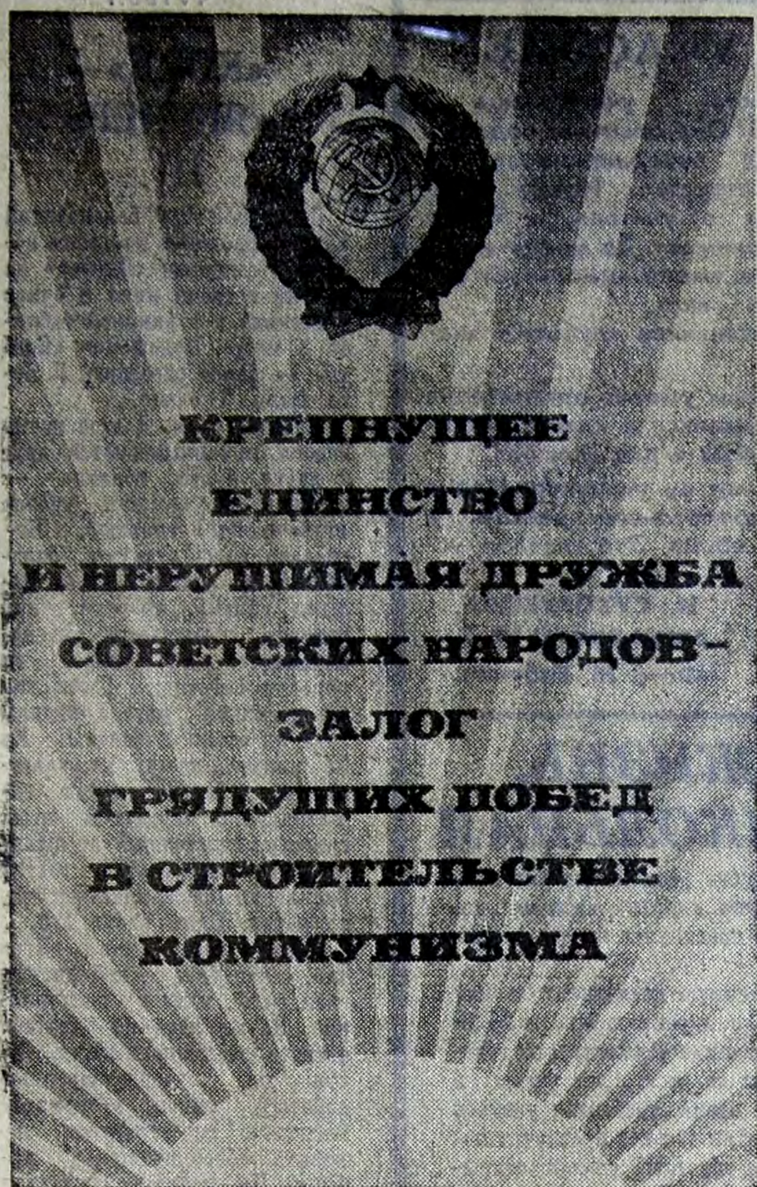
Издательство «Изобразительное искусство» выпустило этот плакат художника К. Мистакиди к 50-летию образования СССР.