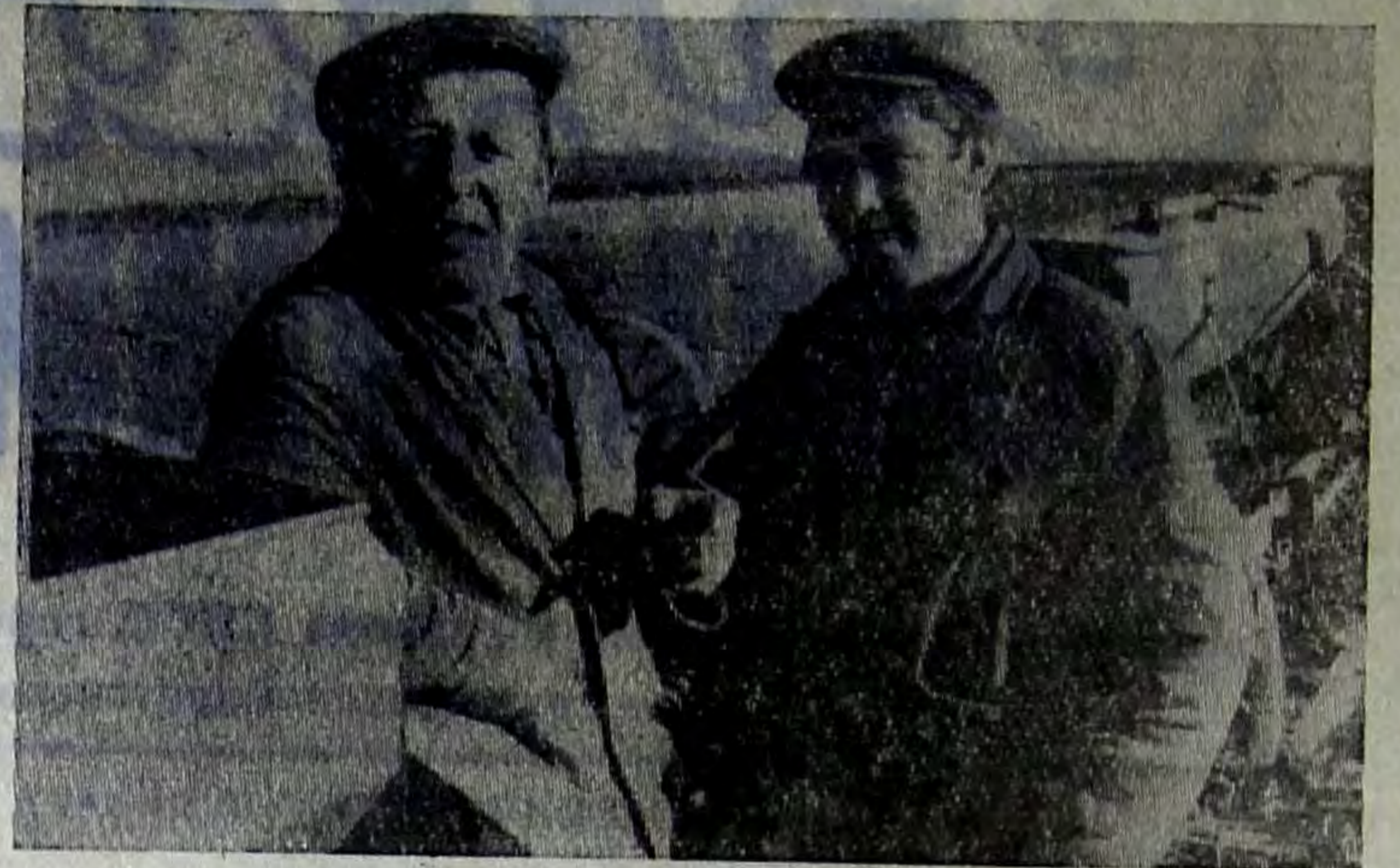
На полях колхоза имени Фурманова полным ходом идет сев кукурузы.

Механизаторы прилагают все силы, чтобы в установленный срок засеять площадь в 564 гектара.