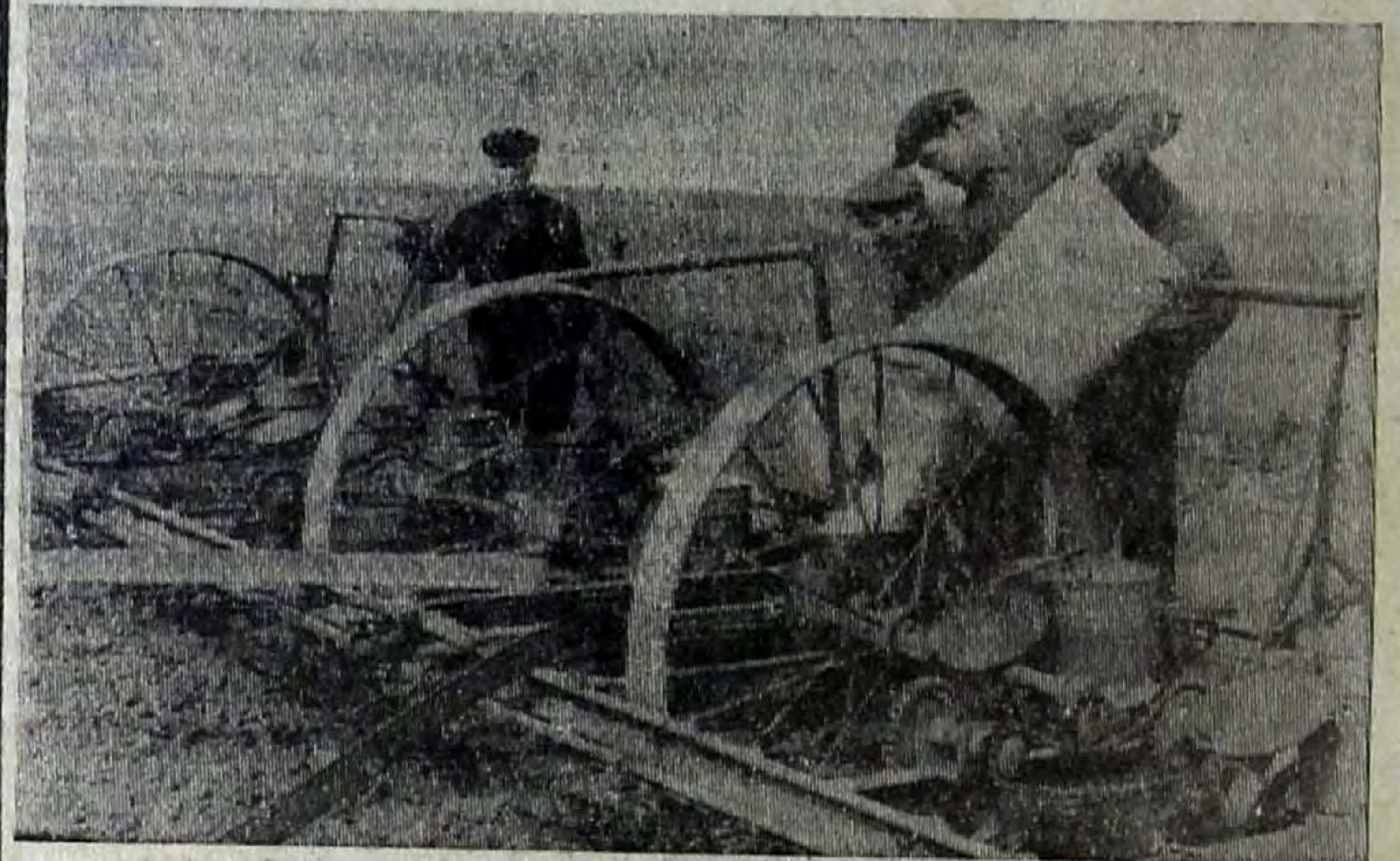
Хлеборобы колхоза «Россия» после успешного завершения сева ранних зерновых приступили к севу кукурузы и в строго намеченные сроки работа была завершена на хорошем агротехническом уровне.